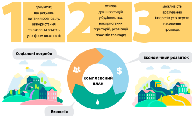
Рис. 1. Комплексний план, як основа розвитку

ку з вирішення проблемних та конфліктних питань, а також з дотриманням принципу збалансованості державних, громадських та приватних інтересів. Комплексний план забезпечує узгоджене прийняття рішень щодо цілісного (комплексного) просторового розвитку всіх населених пунктів як єдиної системи розселення та території за їх межами [4] (рис. 1).