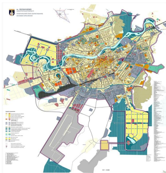
Рисунок 2. Генеральний план міста Мукачєво

Питання регулювання планування, забудови та іншого використання територій вирішиться із застосуванням містобудівної документації. Дана система є одним із інструментів прийняття правильних рішень з управління. Тому, використання ГІС систем при розробці містобудівної документації є важливим фактором. Вона забезпечить можливість для застосування інформації в широкому спектрі завдань, що пов'язані з плануванням рішень стратегічного рівня та їх наслідків із застосування аналізу і прогнозу факторів навколишнього середовища.