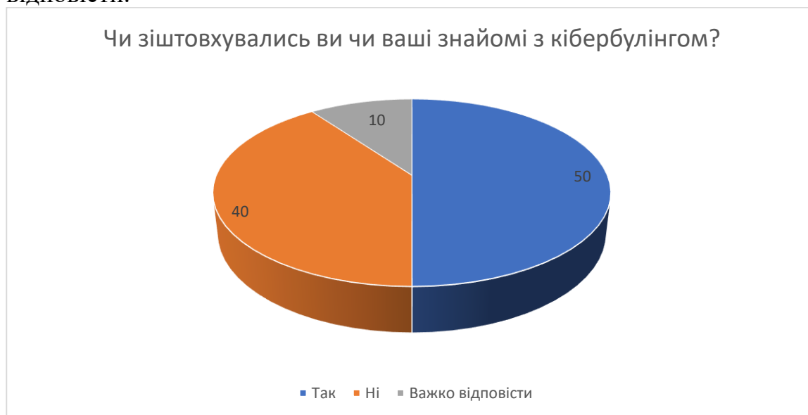
Рис. 2 Чи зіштовхувались ви чи ваші знайомі з кібербулінгом?

Серед всіх опитаних респондентів, на питання «чи зіштовхувались ви чи ваші знайомі з кібербулінгом?» відповіли : 50% (47) так, 40% (37) ні, 10% (9) важко відповісти.