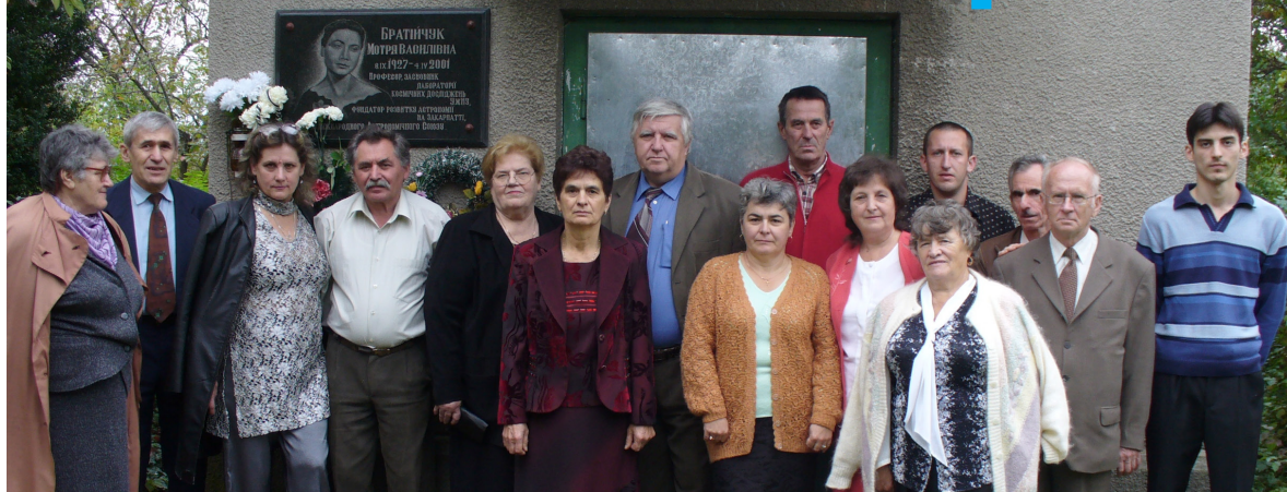
Колектив ЛКД біля пам'ятної дошки М.Братійчук у день 50-річчя космічної ери

Відтоді ЛКД стали залучати з боку СРСР до всіх міжнародних програм, пов'язаних з оптичними спостереженнями ШСЗ. Досягнута за результатами таких спостережень точність визначення місця розташування пункту на Землі (6 метрів) дозволила тоді вченим різних країн нарешті встановити реальну форму нашої планети. Вивчення переміщення земної кори й материків вимагали ще більшої точності спостережень супутників. На допомогу вченим прийшла лазерна локація супутників, яка дозволила визначити положення пунктів на планеті вже з точністю до сантиметрів. І перша лазерна локація космічних апаратів із території СРСР була успішно здійснена, як уже згадувалося вище, у рамках радянсько-французького експерименту в ЛКД УжНУ з використанням французького лазерного далекоміра. Коли вітчизняна промисловість на початку 80-их років випустила першу партію лазерних далекомірів