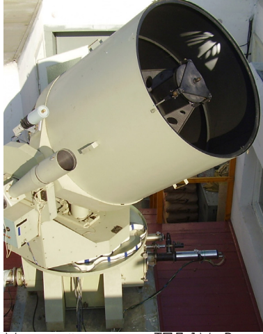
Метровий телескоп ТПЛ-1М. Використовується при спостереженнях далеких космічних об'єктів

хоплював юних спостерігачів, що вони не помічали, як минала ніч навіть у сильні морози. І тільки вдень із подивом відзначали один в іншого обморожені брови від тривалого зитнення з окулярами спеціальних фото- і візуальних камер.