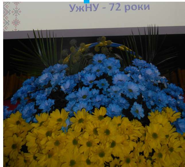
УжНУ - 72 роки