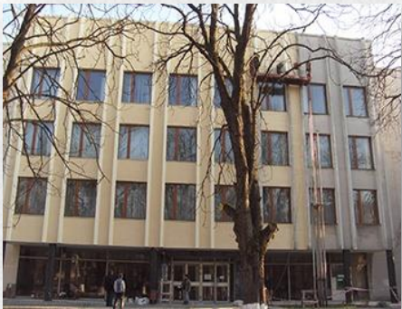
Ректорат ДВНЗ «УжНУ»