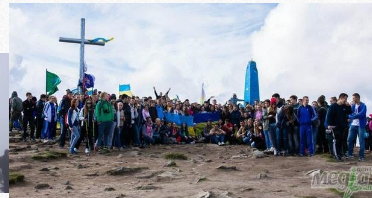
Сходження на г. Говерлу