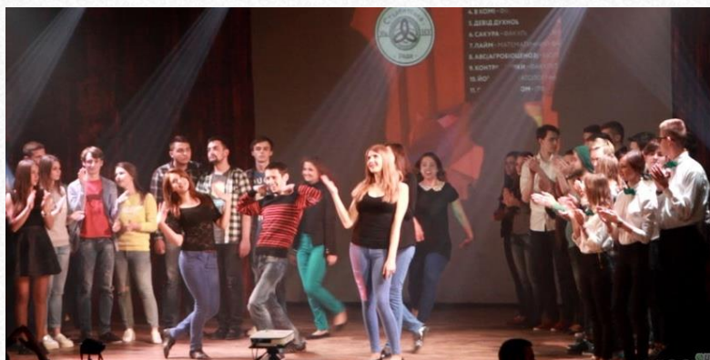
Ліга сміху в УжНУ