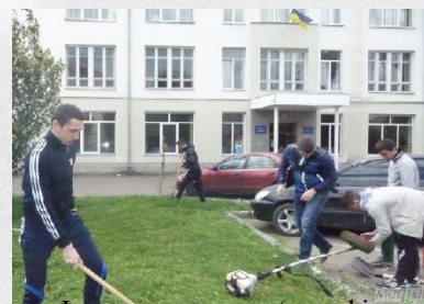
Факультет здоров'я та фізичного виховання