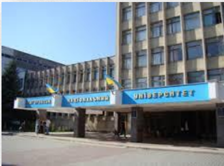
Головний корпус ДВНЗ «УжНУ»