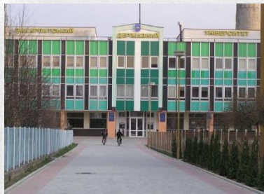
Факультет міжнародних економічних відносин