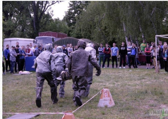
Змагання з пожежно-рятувальних дисциплін «Знати, щоб врятувати»