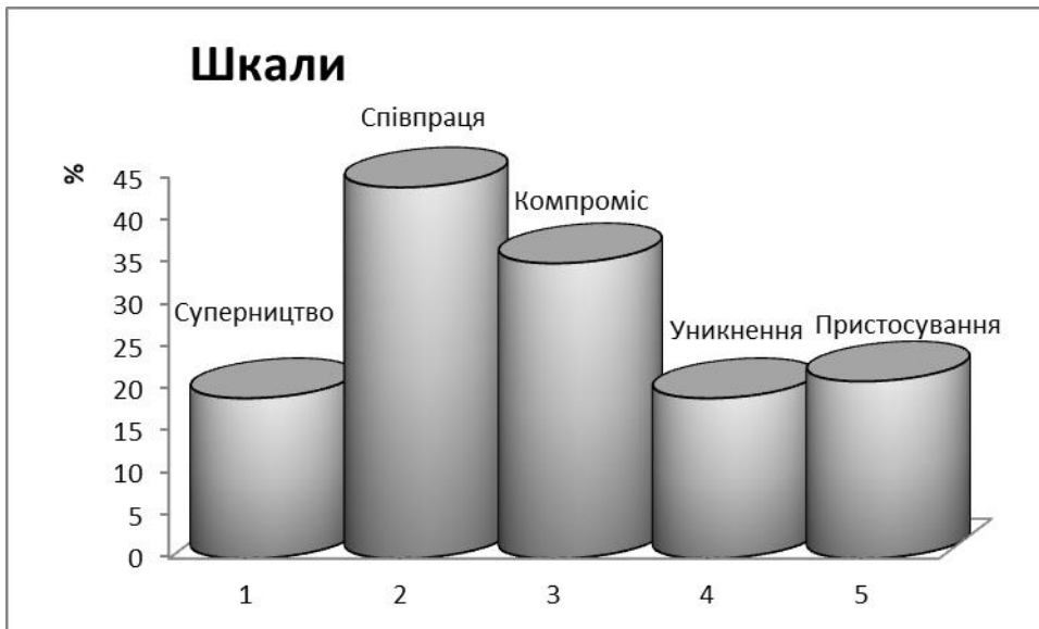
Рис. 2.2.4. Узагальнені результати дослідження у % за методикою діагностики стратегій поведінки у конфліктах за К. Томас.