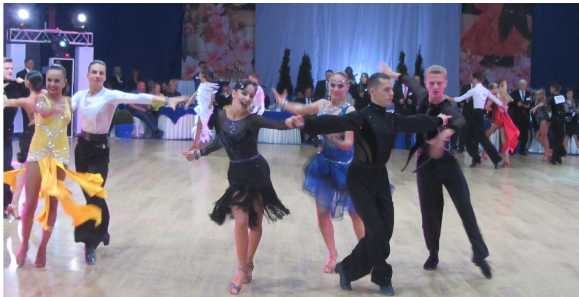
На кращих учасників змагань чекали заслужені нагороди