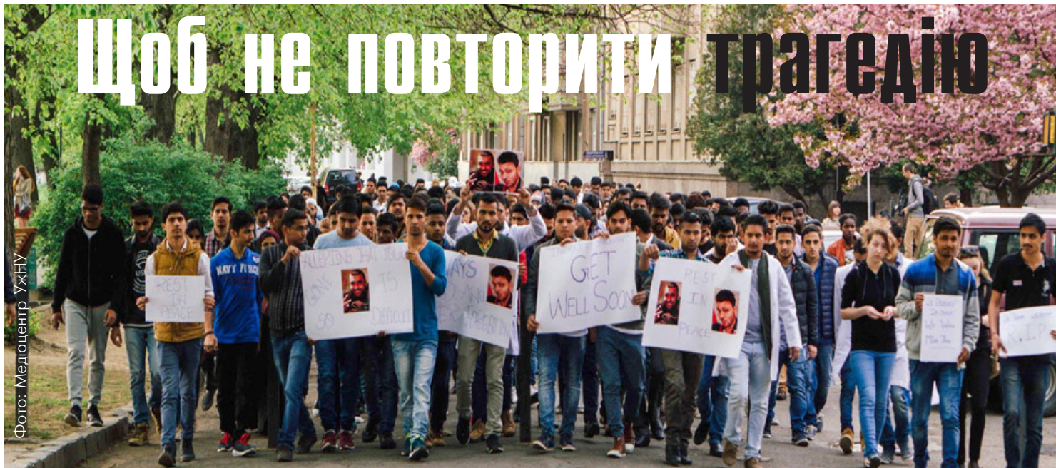
Траурна хода в пам'ять про загиблих

Наступного дня в обласній клінічній лікарні ім. Андрія Новака з іноземними студентами спілкувалися представники Національної поліції та Державної міграційної