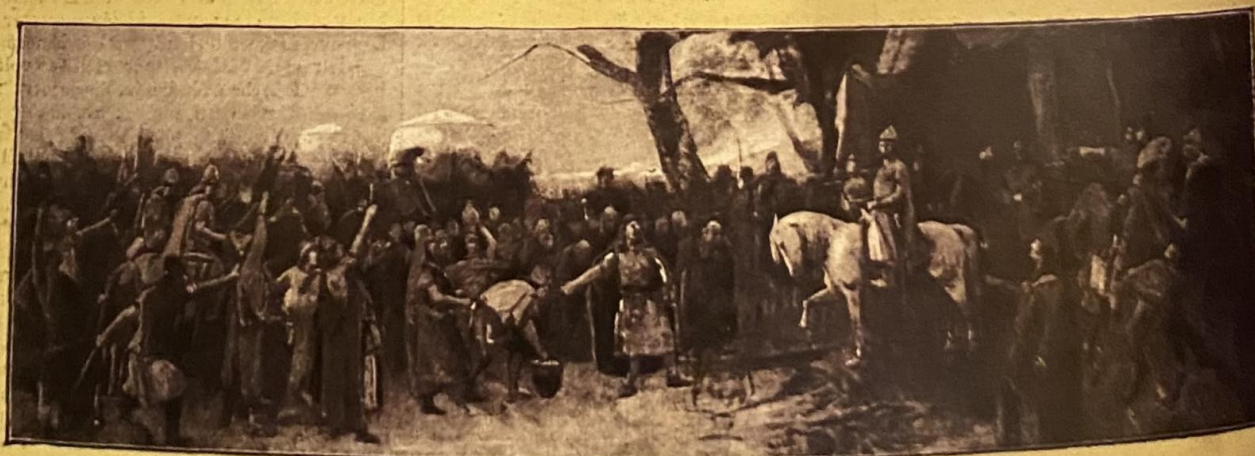
A HARMADIK VÁZLAT.