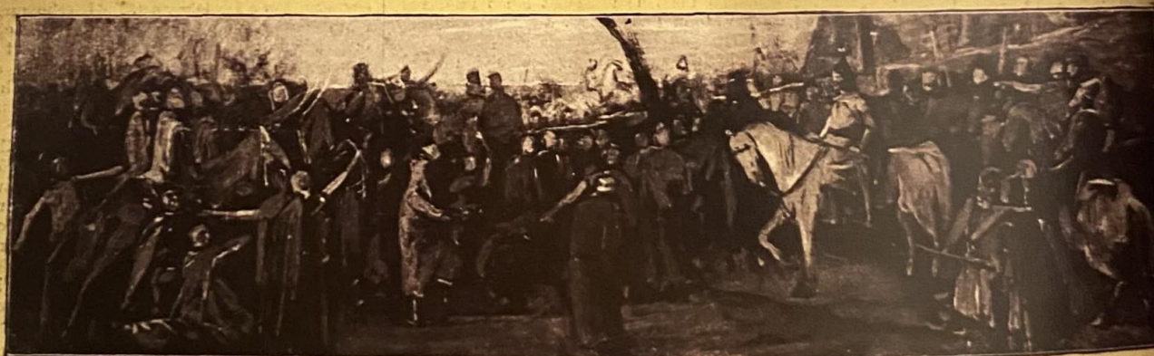
A MÁSODIK VÁZLAT.