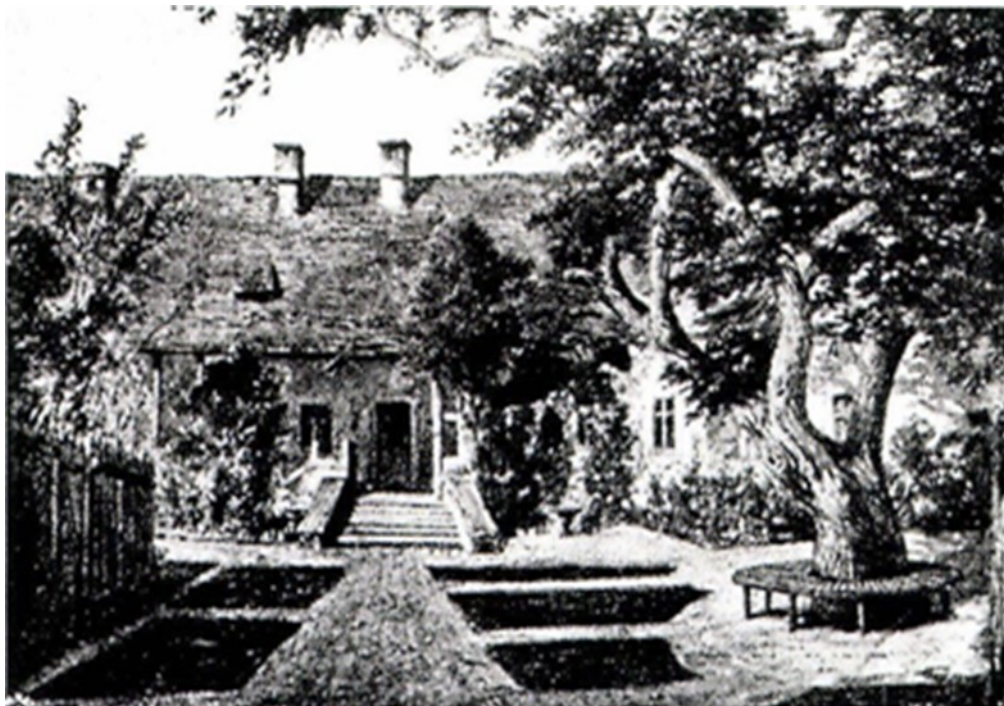
Függelék 4: Munkácsy Mihály Emlékház, Békéscsaba. 2