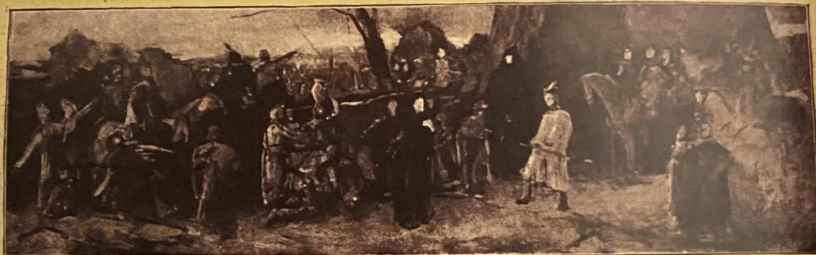
AZ ELSŐ VÁZLAT.