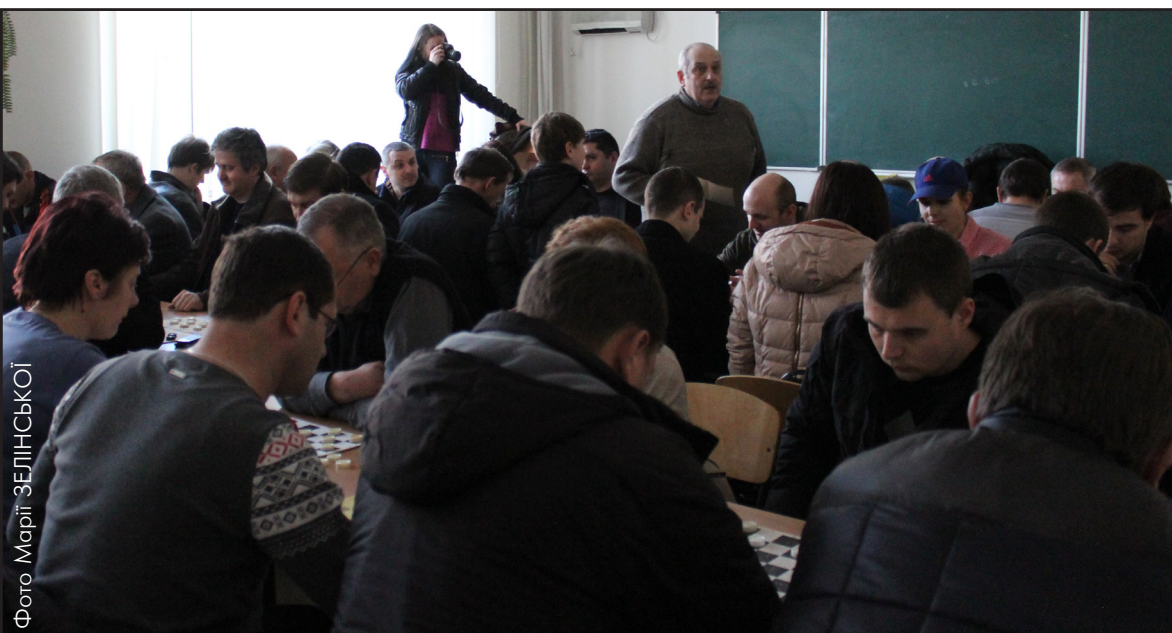
Шашистки встановили рекорд за кількістю команд-учасниць