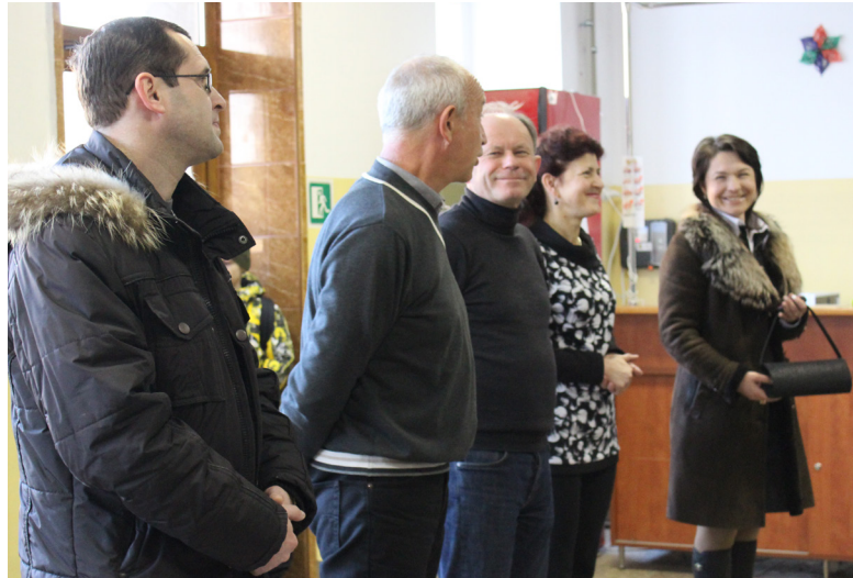
Який же то захід без урочистого відкриття?

Усереду, 18 лютого, стартувала VIII Загальноуніверситетська спартакіада серед викладачів і співробітників УжНУ, яка завершиться в травні.