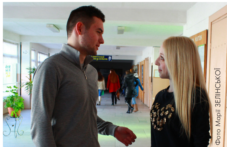
Хлопці, не забувайте говорити приємні слова дівчатам!