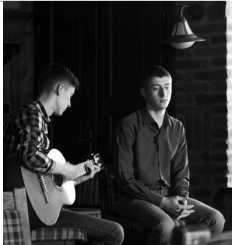
«АйСіQ» в творчому образі

Цікаво: автор текстів проживає в Чернівцях, вокаліст — у Львові, а гітарист — в Ужгороді. Співпрацювати хлопцям вдається через соціальну мережу. У кожного є свої завдання, кожен повинен добре попрацювати, аби сукупно отримати якісний результат.