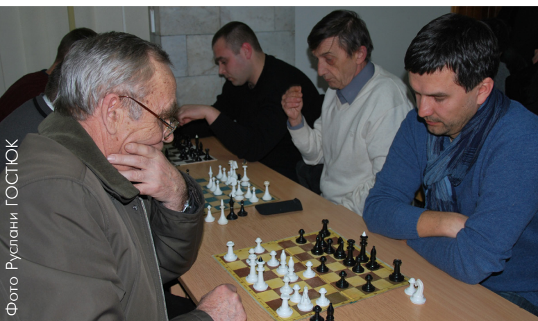
А в шахістів — свої баталії