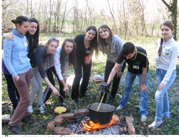
Де ж відпочивати біологам, як не на природі?!

Вони плідно трудяться на науковій ниві різних біологічних та сільськогосподарських напрямів. Це, зокрема, ботаніка, зоологія, ентомологія, гідробіологія, генетика, фізіологія рослин, мікробіологія, молекулярна біологія, екологія, селекція рослин, плідівництво, виноградарство, овочівництво, захист рослин. Але основний напрям практично всіх науковців — це охорона природи та збереження біорізноманіття. Навіть такий прикладний напрям, як агрономія, також розглядається в контексті раціонального використання природних ресурсів з огляду на унікальність Карпатського регіону, його неповторність і різнобарвність.