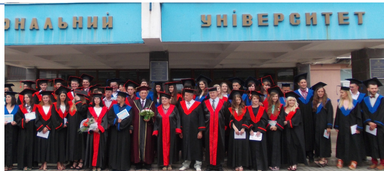
Велика родина географів

У структурі географічного факультету УжНУ діють три кафедри: фізичної географії та раціонального природокористування, землевпорядкування та кадастру, лісівництва. Студенти названого підрозділу завжди активні в громадському та спортивно-культур-