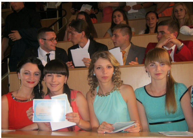
Сучасні фізики з альма-матер — веселі й розумні

Спектр практики вельми масивний. Частина фізиків спеціальності «Фізика ядра та фізика високих енергій» проходить практику в цен-