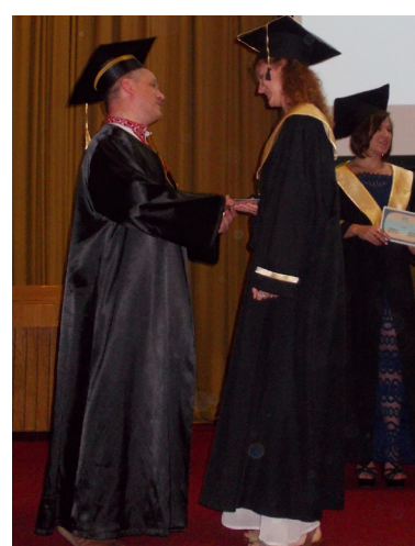
Математики отримують дипломи

року проводимо різні екскурсії. Нещодавно окремі групи їздили на озеро Синевир, також відвідали історичні місця Києва, Львова, Кам'янця-Подільського тощо. На початку навчального семестру для першокурсників організуємо вечір знайомств, який супроводжується дискотекою. У розпал новорічно-різдвяних свят студенти долучаються до акції «Подаруй дитині свято». Тоді збирають кошти й подарунки для дітей-сиріт. Готуємося й до Дня святого Валентина: влаштуємо конкурс на кращу «валентинку», яку описали ставимо на стенд; переможців нагороджуємо цінними призами, зокрема флешками, книжками. Не оминаємо увагою й річницю, видатні події. Наприклад, до 75-ої річниці Карпатської України мате-