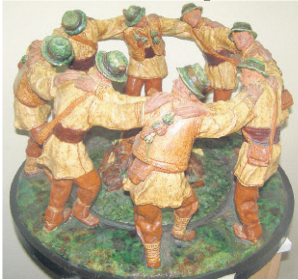
Із робіт автора