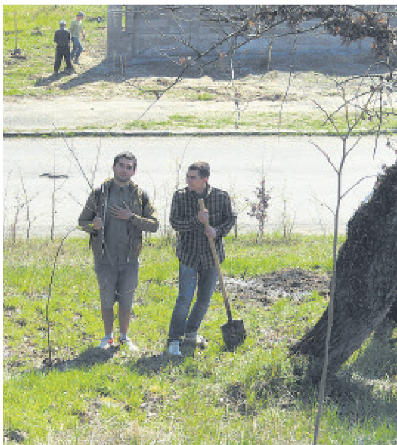
Озеленення — справа благородна!