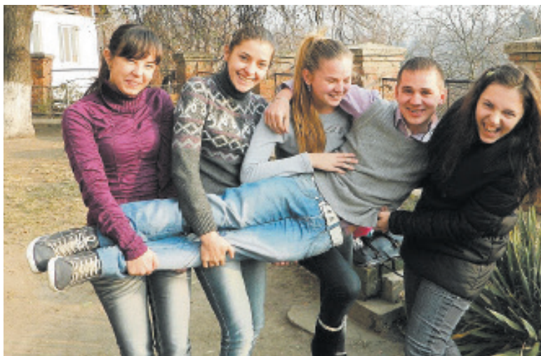
Фізфак тримається і на дівчатах