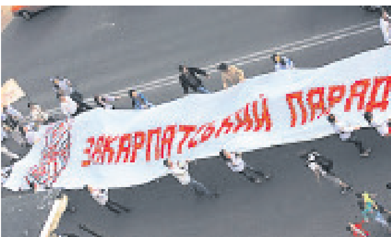
Студенти-волонтери з найдовшим на Закарпатті весільним рушником-2011