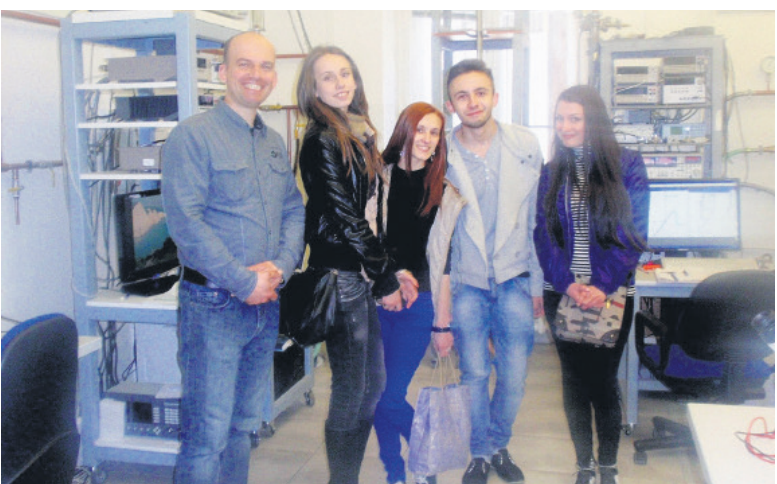
Фізики у Пряшеві