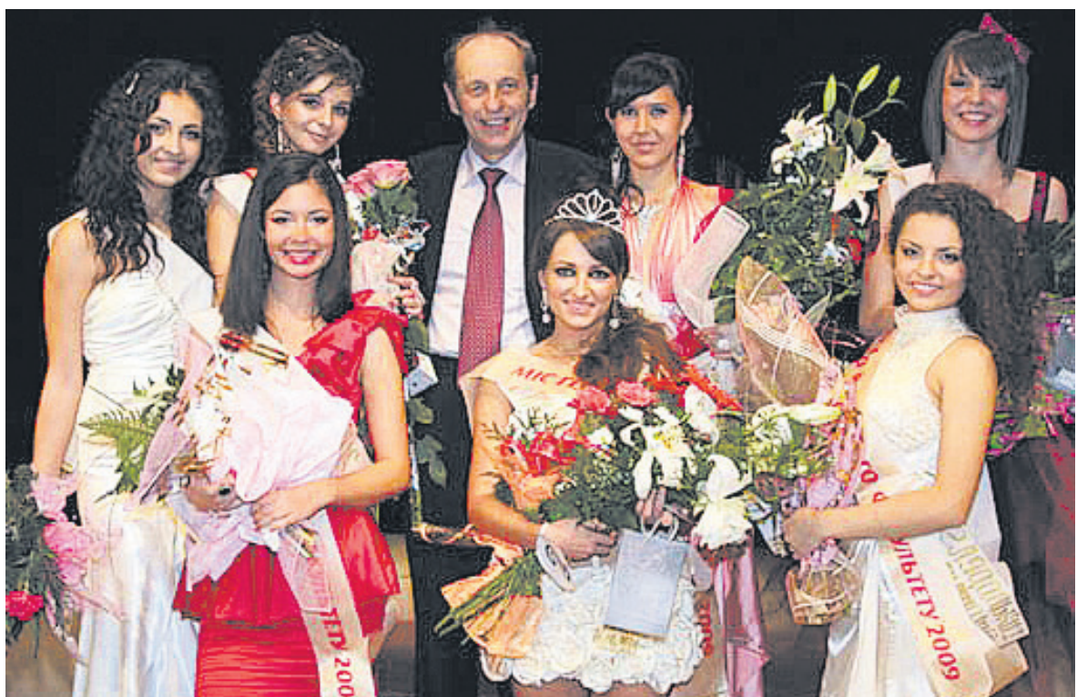
Міс географічного факультету-2009