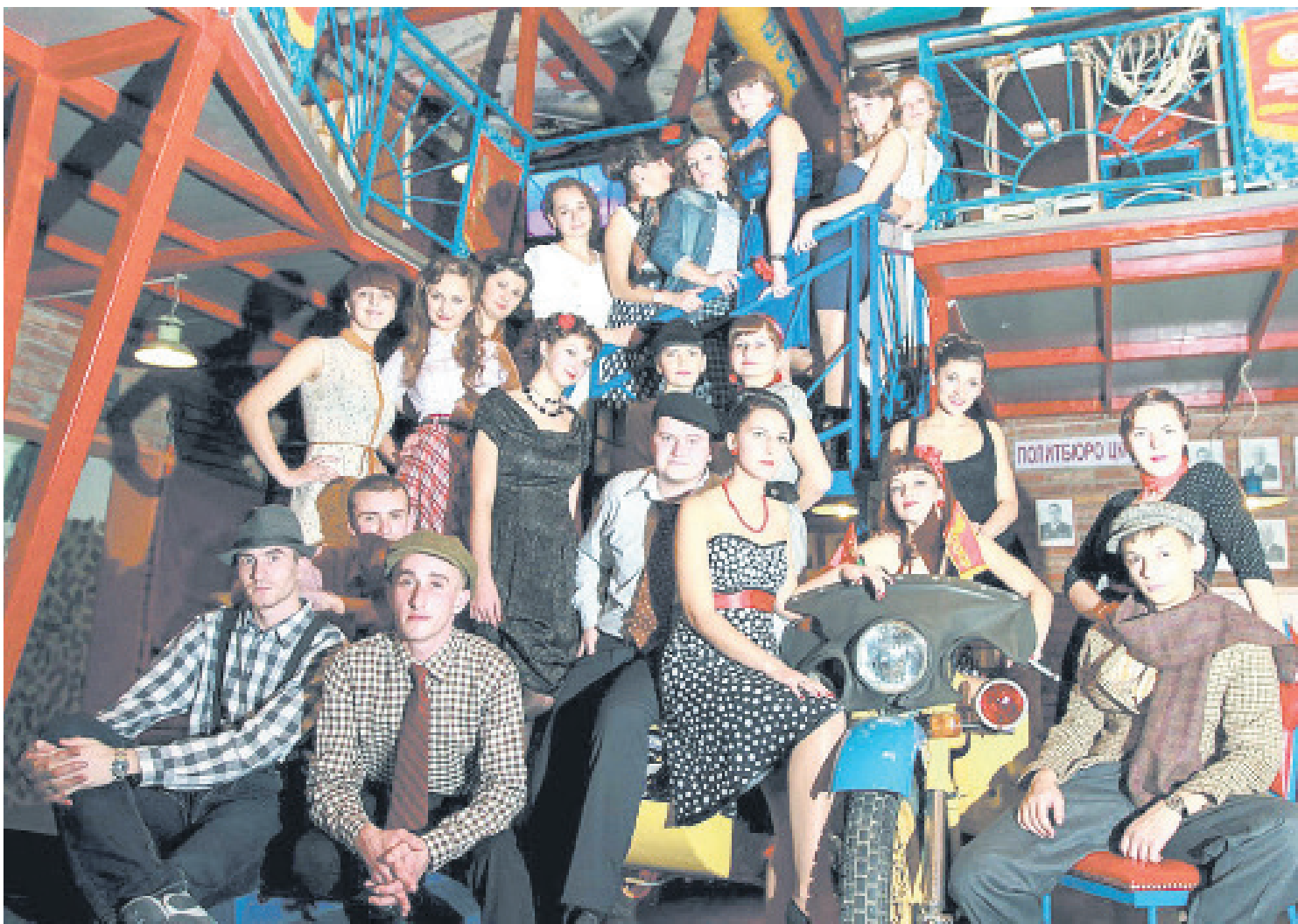
Дружня сім'я фізиків

У національному масштабі фізфак тісно співпрацює з провідними університетами (Київським, Львівським, Чернівецьким, Одеським, Донецьким) та науковими центрами, включаючи інститути НАН України: теоретичної фізики ім. М. М. Боголюбова, фізики, математики, металофізики, фізики напівпровідників, хімії поверхні, Харківський фізико-технічний інститут, а також фізики конденсованих систем, спектроскопії та інші.