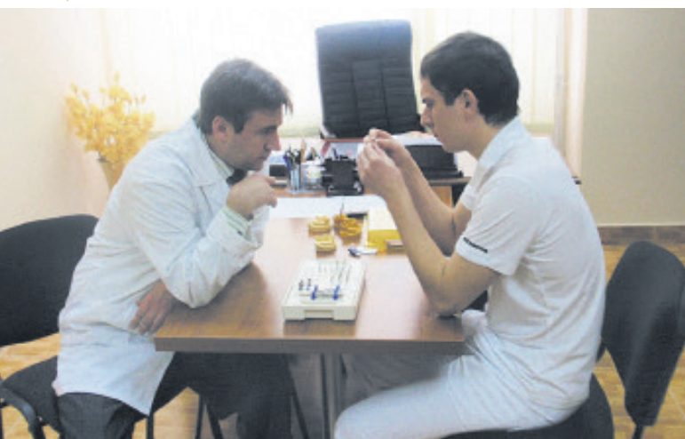
Під час навчального процесу

Своїми враженнями про навчання й дозвілля на стоматологічному факультеті з нами радо поділилися студенти. Отож їм слово.