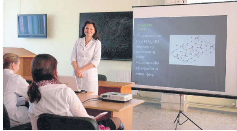
Заняття передбачають застосування сучасних методик викладання

Окрім того, 18 березня 2009 року на базі факультету