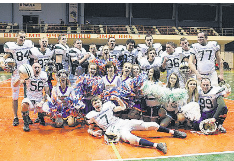
Команда американського футболу разом із черлідерами