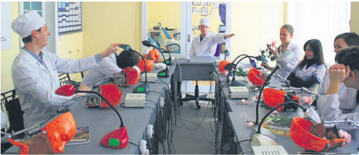
Студенти готові до пари

Звичайно, обсяг матеріалу, який потрібно опрацювати, чималий, зате рівень спеціалістів високий! Тож розповімо докладніше про один із кращих факультетів УжНУ.