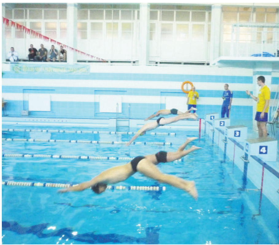
Змагання з плавання серед студентів у залік 62-ї Спартакіади Ужгородського національного університету

Якість роботи басейну забезпечує сучасне устаткування очищення та підігріву води в автоматичному режимі. Відрадно й те, що споруда працює цілий день: у будні з 6.30 до 22.00, а у вихідні та святкові дні — із 9.00 до 20.00. Отже, є можливість поплавати не лише під час занять, а й у зручний час.