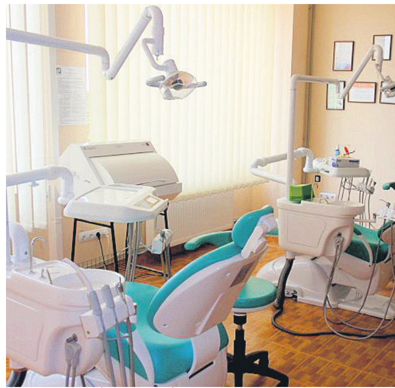
Ось на такому обладнанні відбувається занурення у фак

2011 року відкрито зубопротезну лабораторію із сучасним вітчизняним та зарубіжним устат-