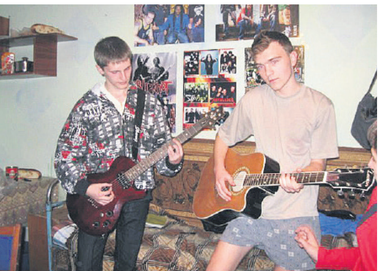
Фізики — натурі музичні