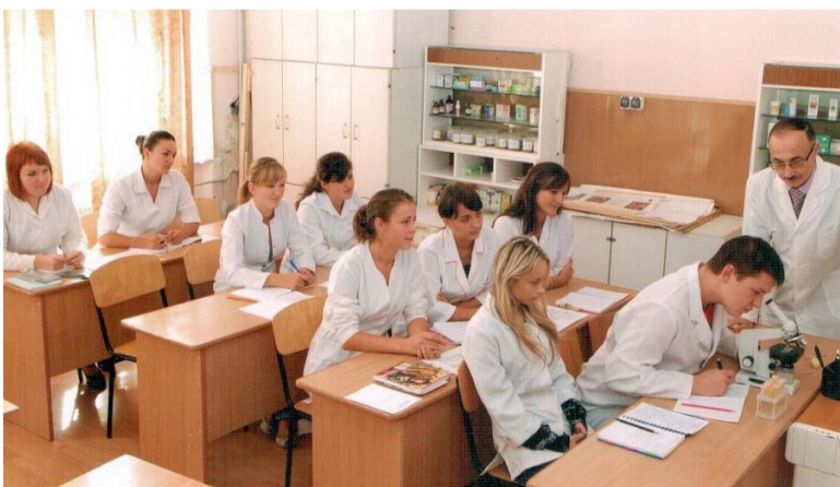
а ось так навчаються фармацевти під час занять

Уперше магістри з фармацевції (як і медики) атестувалися згідно з постановою КМУ №334 від 28.03.2018 «Про затвердження Порядку здійснення єдиного державного кваліфікаційного іспиту для здобувачів ступеня вищої освіти «Магістр» за спеціальностями галузі знань «22 Охорона здоров'я». Це – об'єктивний структурований практичний іспит, який є втіленням кращих іноземних практик. Спрямований на практичну частину та об'єктивність. Так, серед питань у блетах є лише завдання. Кожне з них необхідно виконати в окремій аудиторії чи відведеній зоні (станції), де чітко регламентується час. Його відлічують таймером. Спочатку кожен магістр