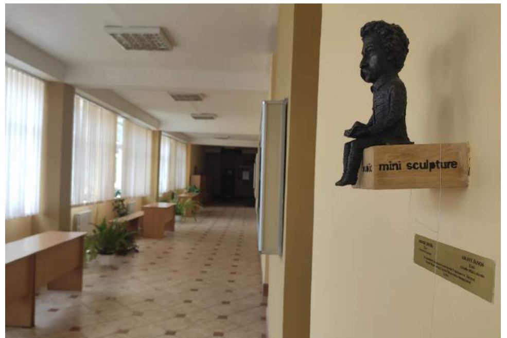
Карантинне життя українсько-угорського навчально-наукового інституту. Замість студентського гамору коридори підрозділу – у суцільній тиші під пильним наглядом мініскульптурки поета Яноша Араня (установлена в 2018 р. за підтримки Генерального консульства Угорщини в Ужгороді).