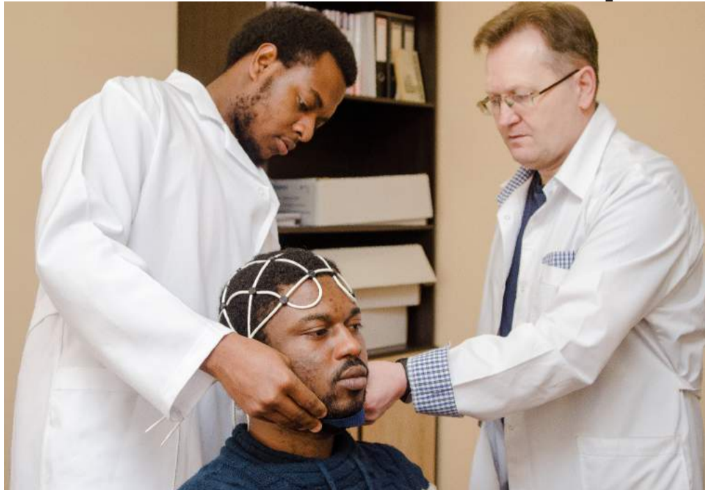
На практичних заняттях з іноземцями