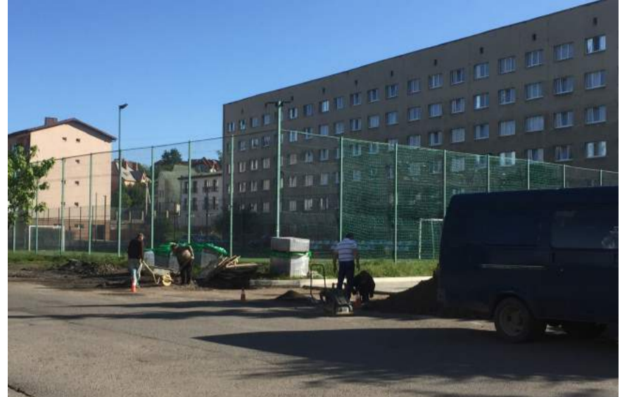
Біля студентського гуртожитку № 4 впорядковують територію. Нову бруківку викладають коштом альма-матер.