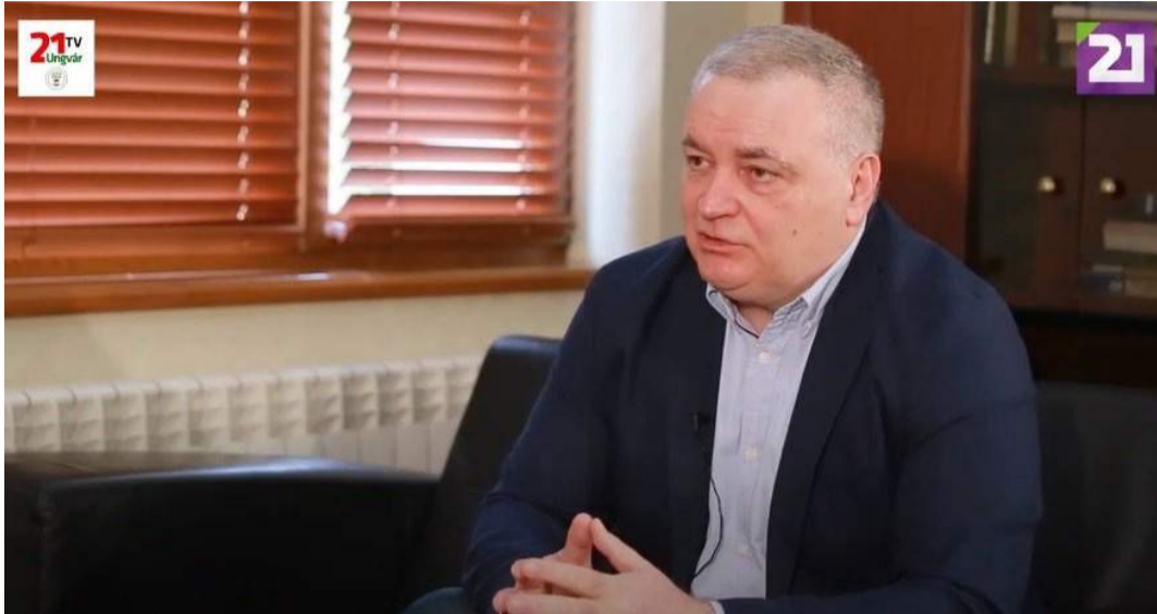
Ректор УжНУ Володимир Смоланка дав інтерв'ю телеканалові TV21 Ungvár. Головна тема – вища освіта на Закарпатті. Докладніше дивіться на офіційному сайті вишу.