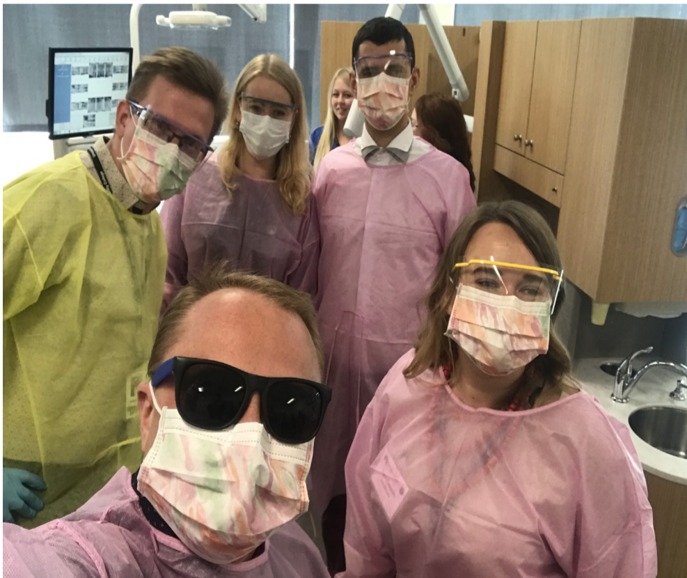
Закінчення. Початок на с. 1.

Завжди резервують час для роботи над помилками, а здобувачі спеціальності не бояться помилятися під час практичних. Наприклад, на занятті в Громадському коледжі Умпква зі студентами (медсестрами) у симуляційній кімнаті, куди нас запросили, дівчина припустилася помилки. Під час обговорення виконання однієї з медичних маніпуляцій викладач запитав, чи, на думку практикантки, при цій маніпуляції все було добре. Студентка задумалась і назвала помилку самостійно, а викладач підказав, як слід робити. Це вигляда-