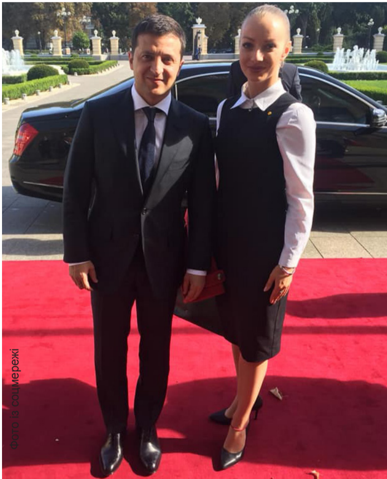
фото із соцімережі

Асистентка кафедри словацької філології УжНУ Надія Мальована працювала в Києві перекладачем під час офіційної зустрічі Президента України Володимира Зеленського