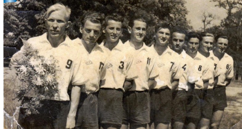
Кінець 40-х років ХХ ст. Склад волейбольної команди Ужгородського університету