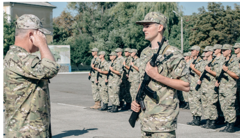
Справжні хлопці та дівчата! Перші випускники кафедри військової підготовки УжНУ склали присягу на вірність Україні