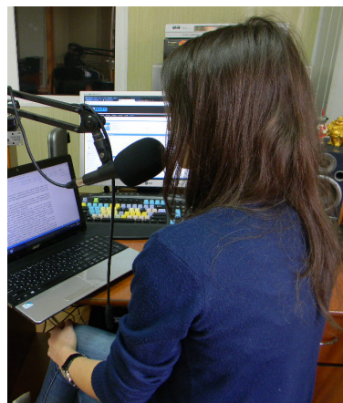
Майбутні журналісти записують власні радіопрограми