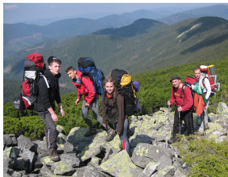
Туризмознавці не сидять на місці...