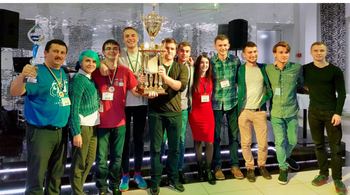
Команда УжНУ здобула «срібло» у півфіналі чемпіонату світу з програмування й виборолла Кубок України