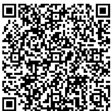
До уваги випускників шкіл