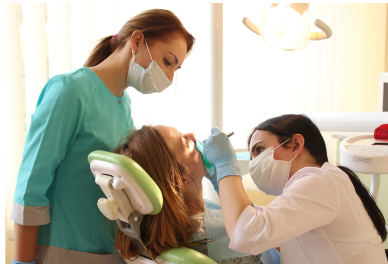
Стоматологи практикуються на сучасному обладнанні