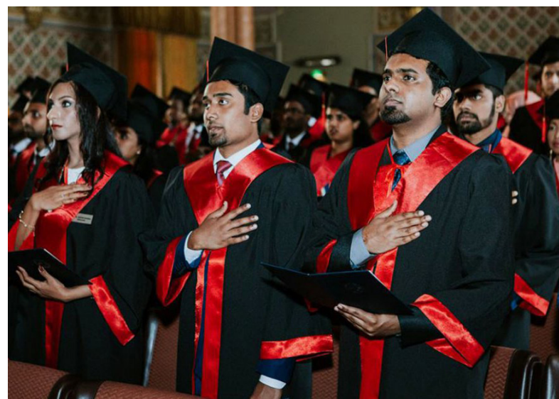
Іноземні здобувачі фаху на урочистому врученні дипломів