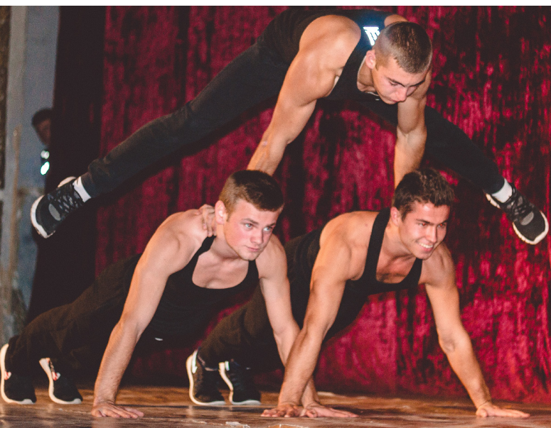
На фестивалі «Студентська осінь»