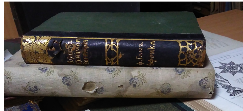
Не просто в бібліотеку, а за старовинними виданнями!