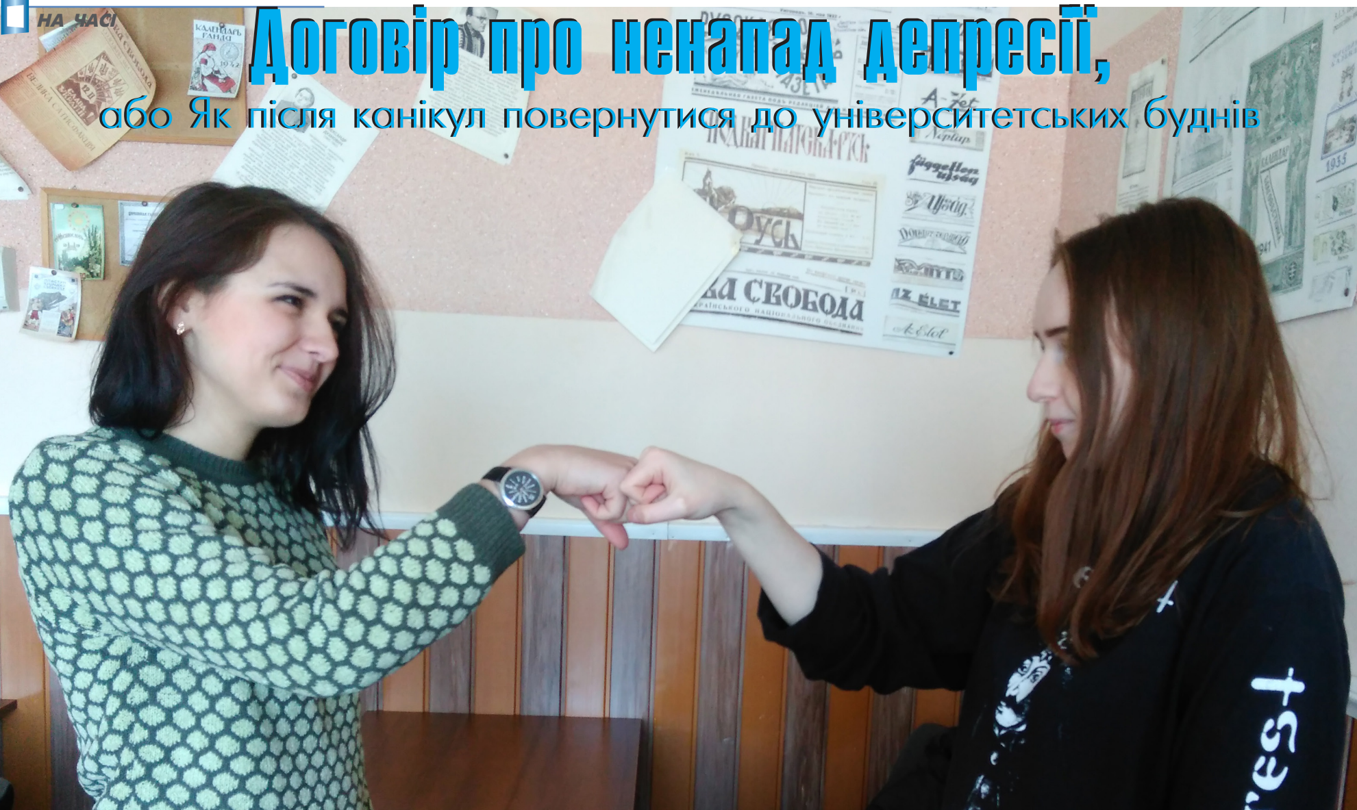
Порадійте зустрічі з одногрупниками так, як це роблять рекламісти відділення журналістики

або Як після канікул повернутися до університетських буднів