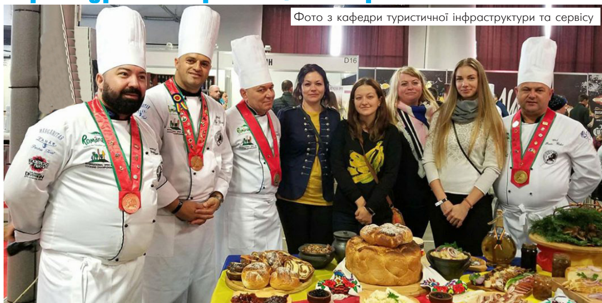
Фото з кафедри туристичної інфраструктури та сервісу