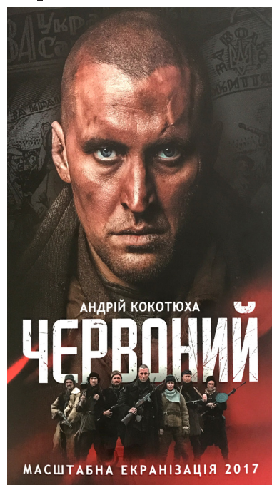
МАСШТАБНА ЕКРАНІЗАЦІЯ 2017

Серед переваг стрічки варто назвати неперевершену гру акторів, які повністю ввійшли в роль; правдивість фільму, заснованого на реальних обставинах; вдовичність (для стрічки спеціально будували в'язницю, де відбувалися