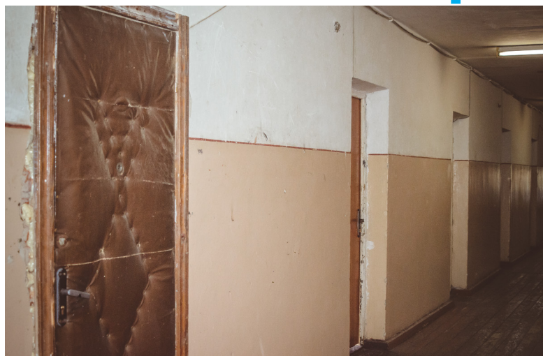
Жити до ремонту