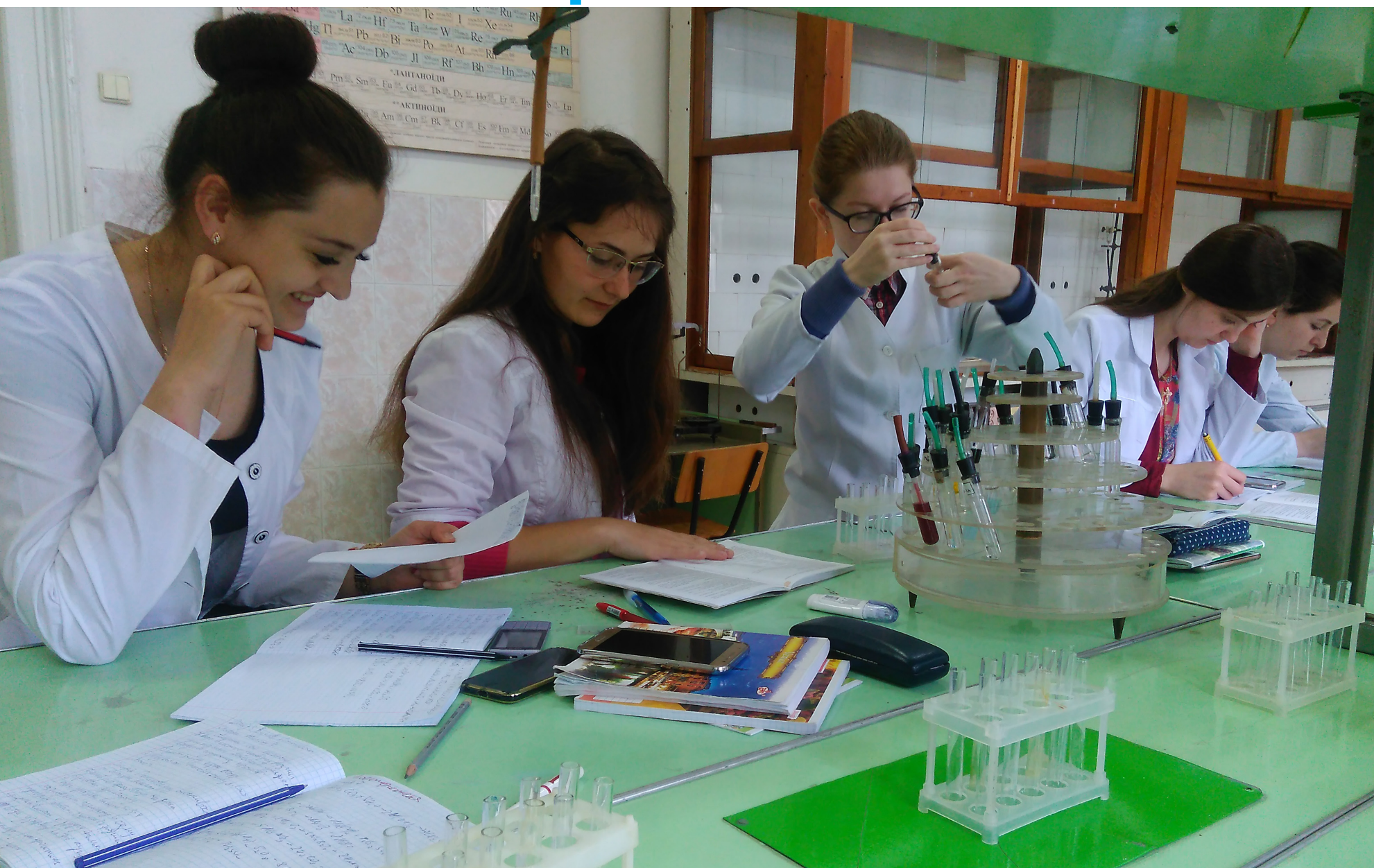
У хіміків буде свій ПершOVERесень