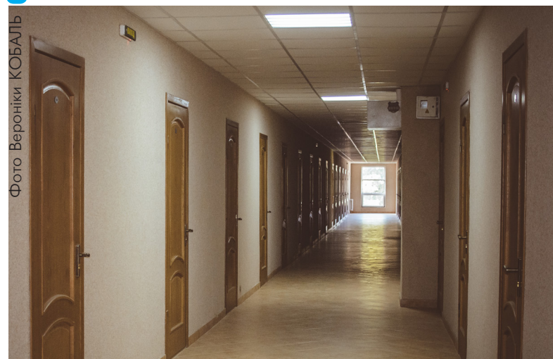
Жити після ремонту

Думками від усього побаченого поділився В.Смоланка: «Ми відвідали мережу об'єктів, де тривають роботи. Враження загалом хороші. Наш підхід полягає в тому, щоб не латати об'єкти, а планувати великі ремонти й забезпечити порядок на багато років. Працюватимемо в тому ж дусі. У наступному році передбачимо кошти. Фінансове становище університету стабільне. І на відміну від більшості українських університетів — я бачив звіти їх ректорів — навіть найкрупніші флагмани нашої освіти не можуть виділяти на ремонти такі гроші, які виділяємо ми. Лише поточні роботи виконали або ведемо на 52 об'єктах на загальну суму понад 2 мільйони 420 тисяч гривень, а на 8 об'єктах — реконструкції або капітальні ремонти — на по-