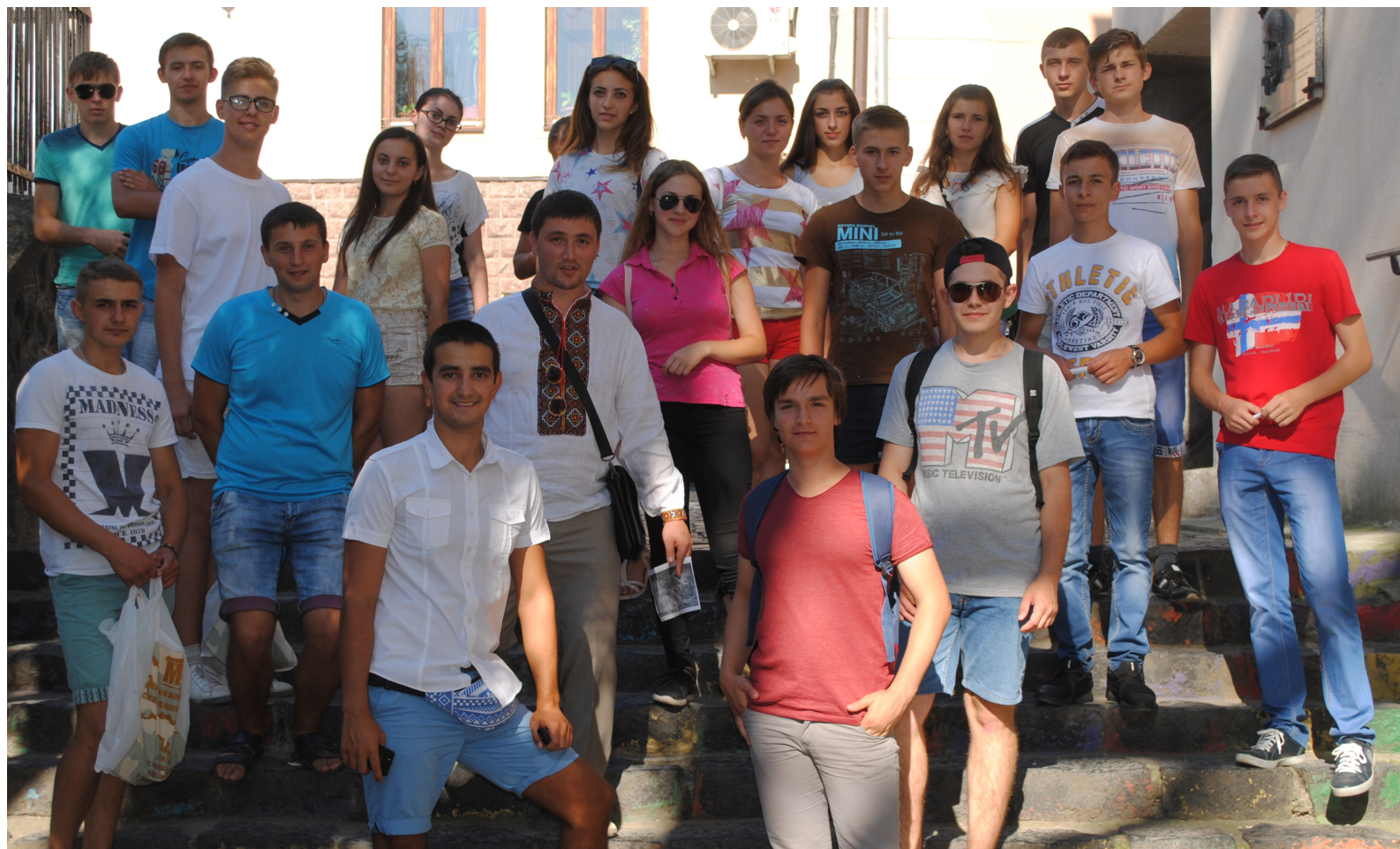
Ознайомча екскурсія Ужгородом для I курсу, 2016 р.

За інформацією факультету матеріал підготувала Мирослава ГАРАЗДІЙ, «Погляд».