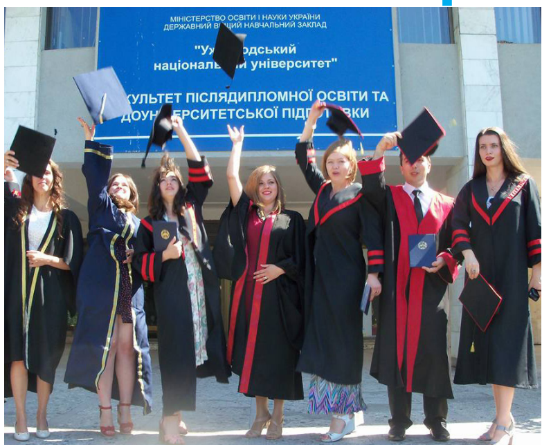
А ви бажаєте здобути ще одну вищу освіту?

Щодо наступної вищої освіти, то фахівців готують із правознавства, фінансів, обліку й аудиту, банківської справи, економіки підприємства, міжнародних економічних відносин, політології, української мови та літератури, журналістики, мови та літератури (англійської та німецької), математики, міського будівництва та господарства, плодоовочівництва