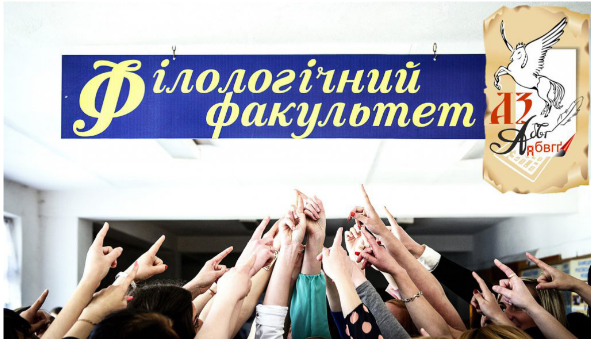
Вступайте на філологічний факультет!

Ми співпрацюємо з вищими навчальними закладами й науковими інституціями різних країн, зокрема з Пряшівським університетом та університетом у Банській Бистриці (Словаччина), Карловим університетом (Чехія), Сегедським, Дебреценським і Будапештським університетами (Угорщина), Новосадським університетом (Сербія),