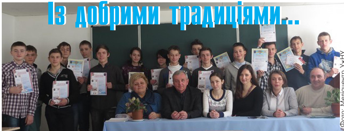
На обласній олімпіаді юних інформатиків у коледжі

Випускники складають фахове вступне випробування. На деяких підрозділах здійснюють прийом на навчання за скороченими термінами підготовки бакалавра (2-3 роки) із можливістю навчання за державним замовленням або ж їх зараховують