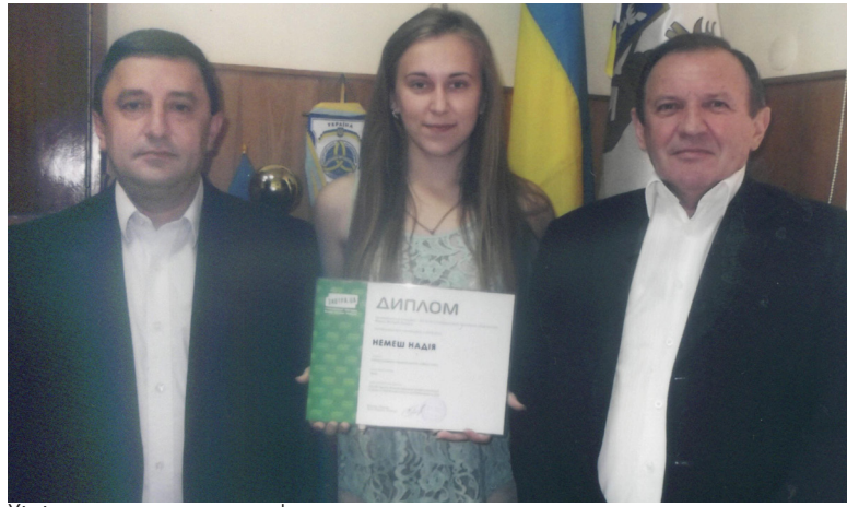
Хіміки теж перемагають!

Тут шанують та з теплом згадують усіх випускників. Особливо ж пишаться видатними науковцями, які колись отримали диплом на хімфаку. Так, професор В.Кошечко став авторитетним спеціалістом у галузі фізичної хімії, академіком і віце-президентом Національної Академії наук України, директором Інституту фізичної хімії ім. Л.В.Писаржевського НАНУ