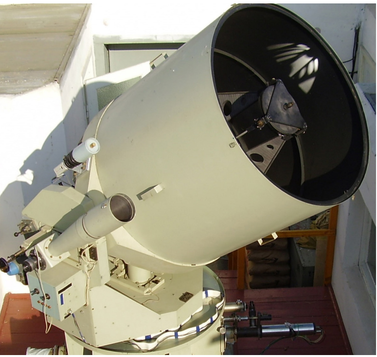
Бути зі складними приладами на «ти» — перевага фізиків