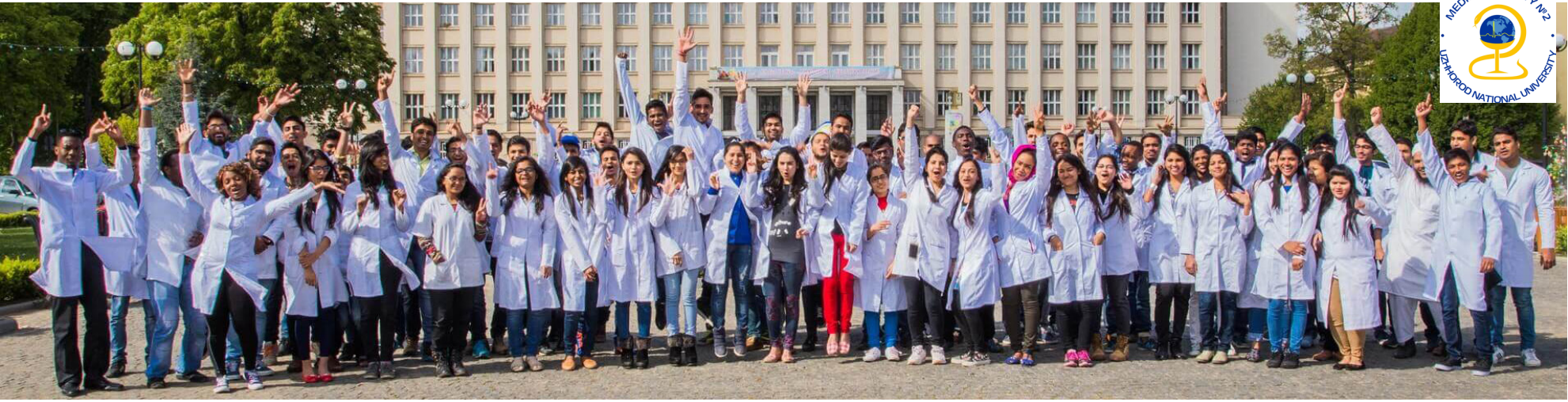
В УжНУ здобувають освіту й іноземні студенти