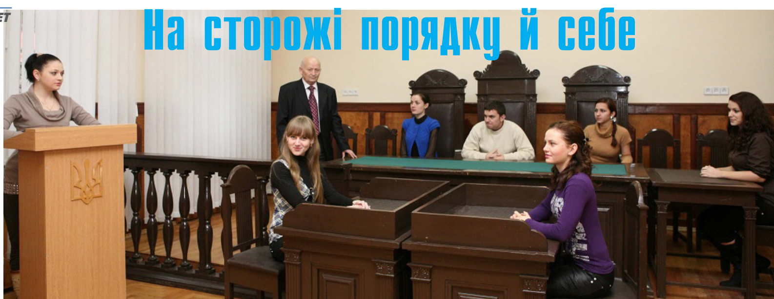
Практичне заняття в юристів

збагнути те, про що свого часу сказав французький учений-енциклопедист Ж.Д'Аламбер: «Істинна рівність громадян полягає в тому, щоб усі вони однаково були підлеглі законам». До того ж у підрозділі букву закону дають можливість пізнати студентам не лише на теоретичному, а й значною мірою на практичному рівнях. Юнаки й дівчата мають змогу пройти різноманітне навчальне стажування в адміністративних, правоохоронних органах, судах, в адвокатурі, нотаріаті, кращих юридичних фірмах, компаніях, установах. Ставку зроблено на те, аби максимально врахувати потреби сучасного роботодавця. Крім того, здобувачі фаху самі надають правову допомогу малозабезпеченим громадянам у юридичній клініці, яка діє при факультеті.