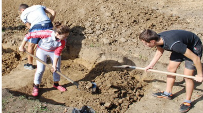
У пошуках старожитностей

Америци, сучасних іноземних (англійської, німецької, французької, іспанської) та регіональних мов (словацької, чеської, угорської, румунської, польської) — для здобувачів фаху за спеціальністю 032 «Історія та археологія», спеціалізацій (освітніх програм) Центральноєвропейські студії, Археологія, Американістика.