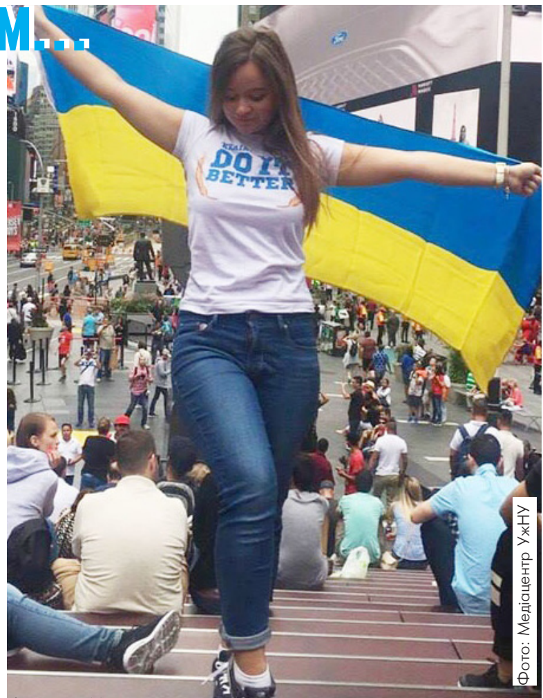
Факультет МЕВ відкриває широкі можливості пізнати світ

За інформацією факультету матеріал підготувала Мирослава ГАРАЗДІЙ, «Погляд».