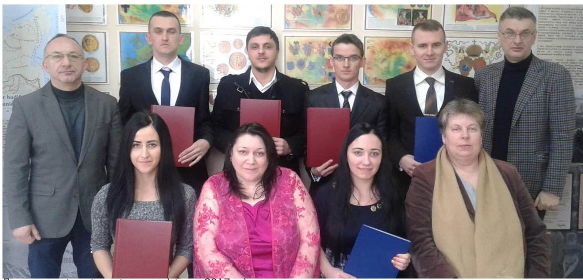
Дипломовані магістри-історики (січень 2017 р.)

Після закінчення навчання студенти-міжнародники можуть працювати дипломатичними агентами, дипломатичними кур'єрами, помічниками експерта із зовнішньополітичних питань, помічниками політичного оглядача, інспекторами із основної внутрішньополітичної діяльності, інспекторами з туризму, секретарями дипломатичного агентства, помічниками консультанта із зовнішньополітичних питань, аташе, уповноваженими, секрета-