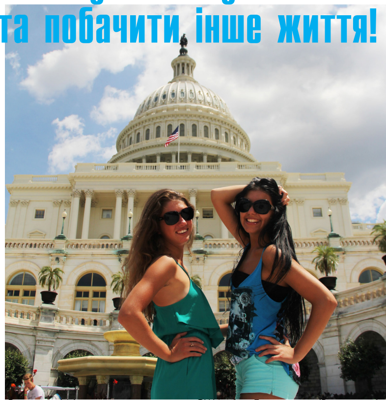
Студенти ФФ під час стажування у США: біля Білого дому (Вашингтон)

бакалаврів, спеціалістів та магістрів з іноземної філології в розпорядженні викладачів — також відповідна навчально-матеріальна база, зокрема комп'ютерний клас, кафедральні книжкові фонди, окремий філіал іноземної літератури з понад 225-тисячним фондом навчальної, науково-методичної, художньої, довідкової та періодичної літератури, створено аудіовідео клас.