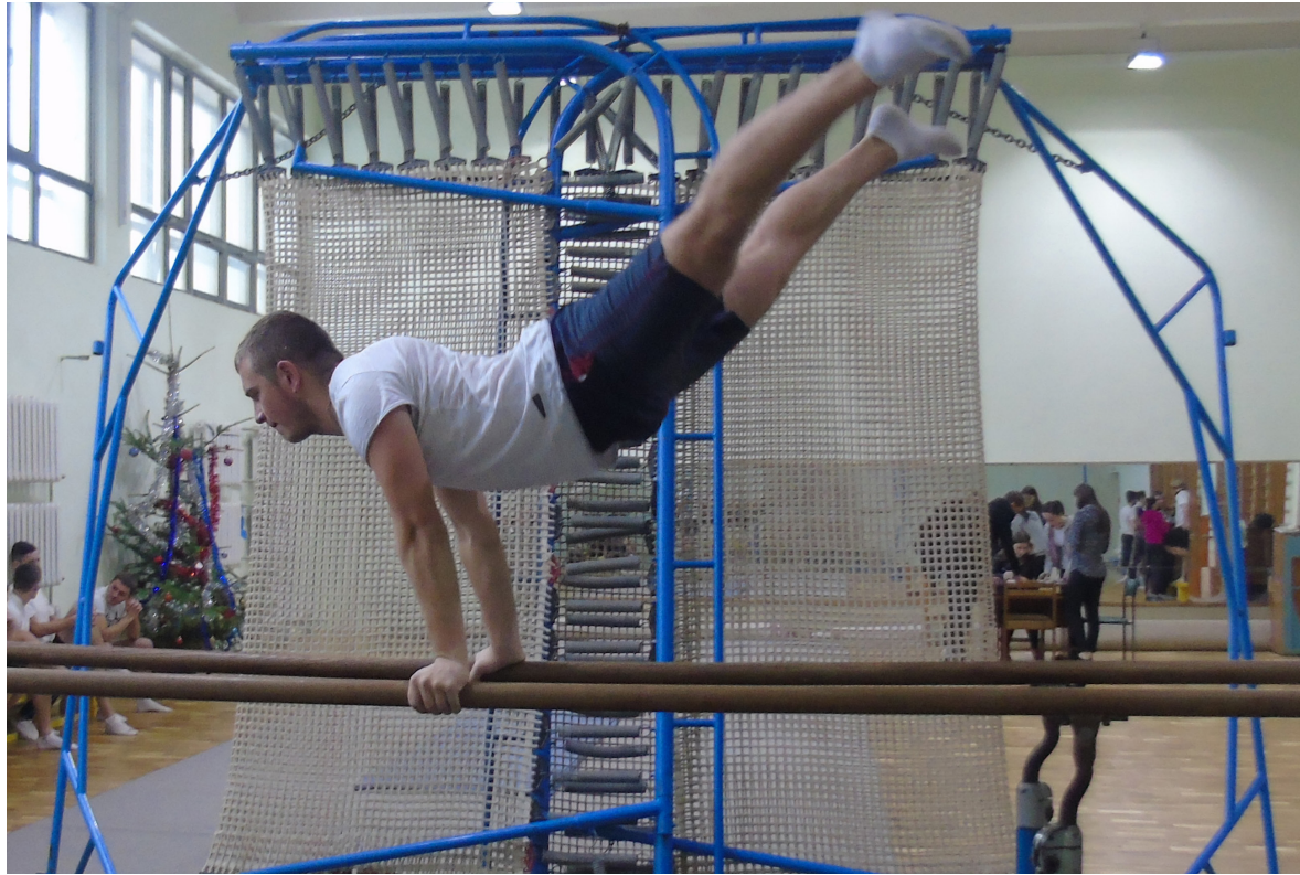
КФВ має різноманітну матеріальну базу