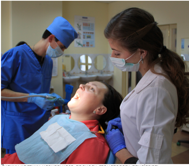
Значну частину навчального процесу стоматологи приділяють практичним заняттям

Словаччини, Чехії, Грузії, країн Прибалтики.